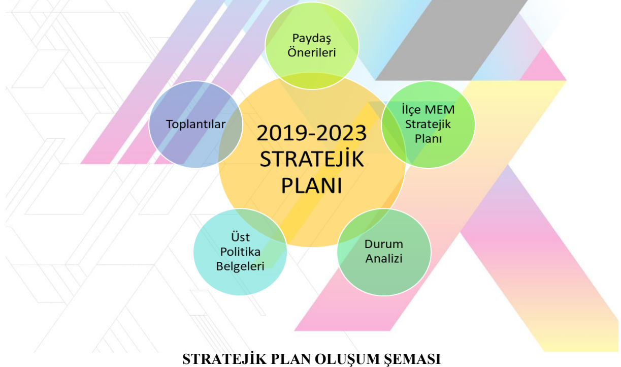
STRATEJİK PLAN OLUŞUM ŞEMASI